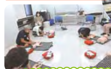
今日のおやつ 家でも早速つくってみます

子どもと赤ちゃんの人形を使用した救命救急講座は たいへん勉強になりました(受講生)