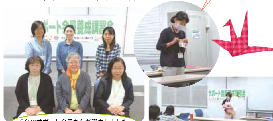
5名のサポート会員さんが誕生しました