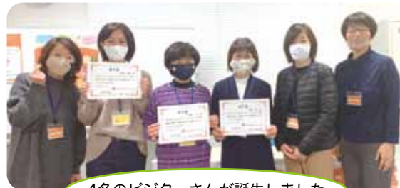
4名のビジターさんが誕生しました