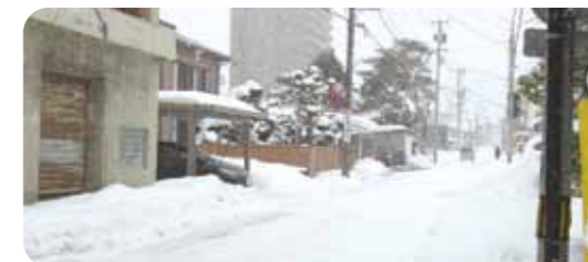
事務所北側の通り

いつもお忙しい中、貴重な時間をサポート活動に充てて下さりありがとうございます。特に今年は雪が多く、道路の凍結や視界不良、それに加えてコロナ対策など、普段以上に神経を遣い、大変な思いをされたことと思います。安全第一でのサポート活動、本当にありがとうございます。