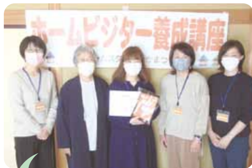
1名のビジターさんが誕生しました!