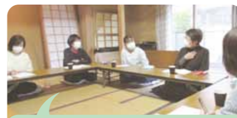
4名のビジターさんが参加しました!

ホームスタートの活動で感じていること等をオーガナイザーやビジター同士で共有できました。少ない人数でしたが、とても貴重な時間でした。