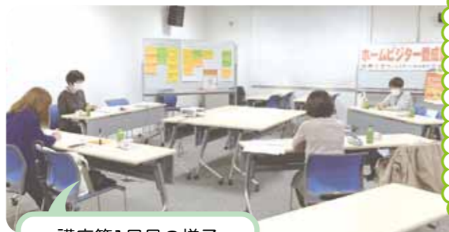
講座第1日目の様子

訪問の流れがよく分かりました。具体例のお話もたくさんあり、想像しやすかったです。集中して取り組まなければならないなと思いました。(受講生)